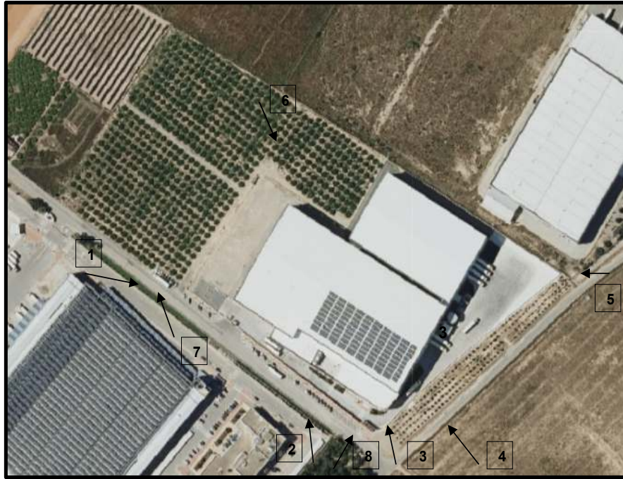
GUÍA DE IMÁGENES